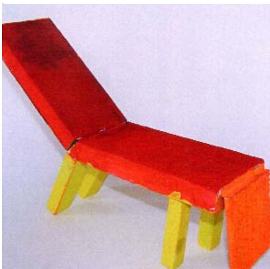
Maquette " Peluche "