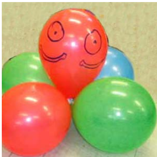
Maquette " Baloons "