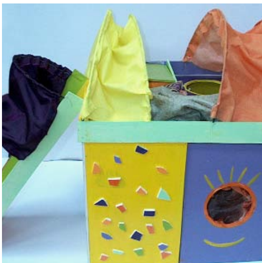
Maquette " Ma planète "