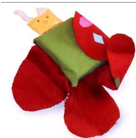
Maquette " Petit voyageur "